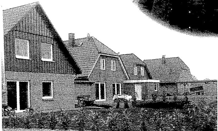
Die Bebauung des Baugebiets „Alte Weide“ in Köln-Reisiek ist zügig vorangeschritten.