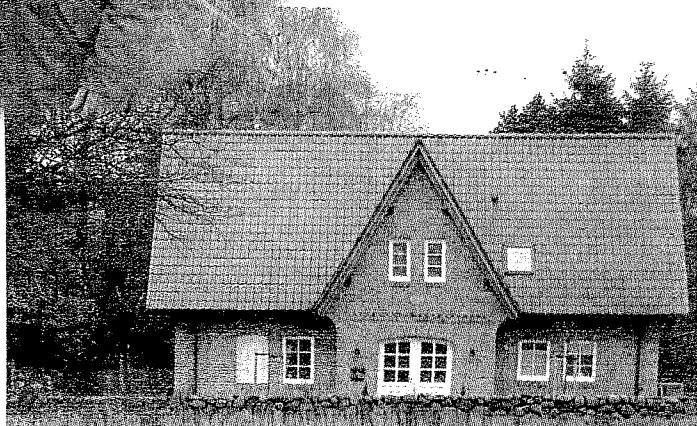
Idyllisches Wohnen pur in Köln-Reisiek. Hier sind noch einige schöne Bauvorhaben realisierbar.